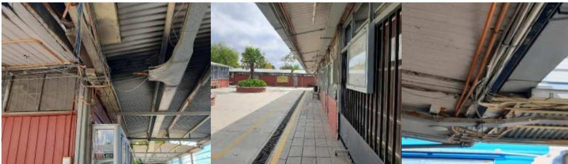
PROBLEMAS DE CANALIZACIONES Y CONDUCTORES