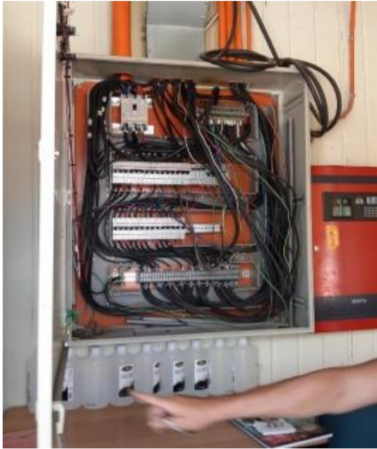
PROBLEMAS EN PROTECCIONES Y TABLEROS