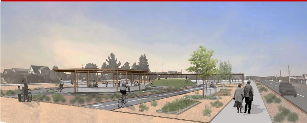
IMAGEN REFERENCIAL / VISTA SUR

OBRA: PARQUE EDUCATIVO PARA LA SEGURIDAD VIAL, SECTOR MAGISTERIO, TALCA