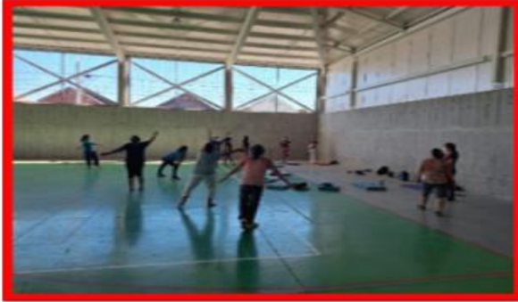
TALLER DE DANZA CESFAM BICENTENARIO