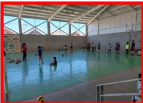
ESCUELA DE VERANO VÓLEIBOL