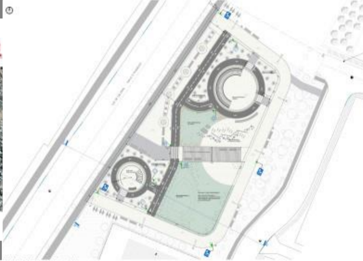
PLANTA DE ARQUITECTURA