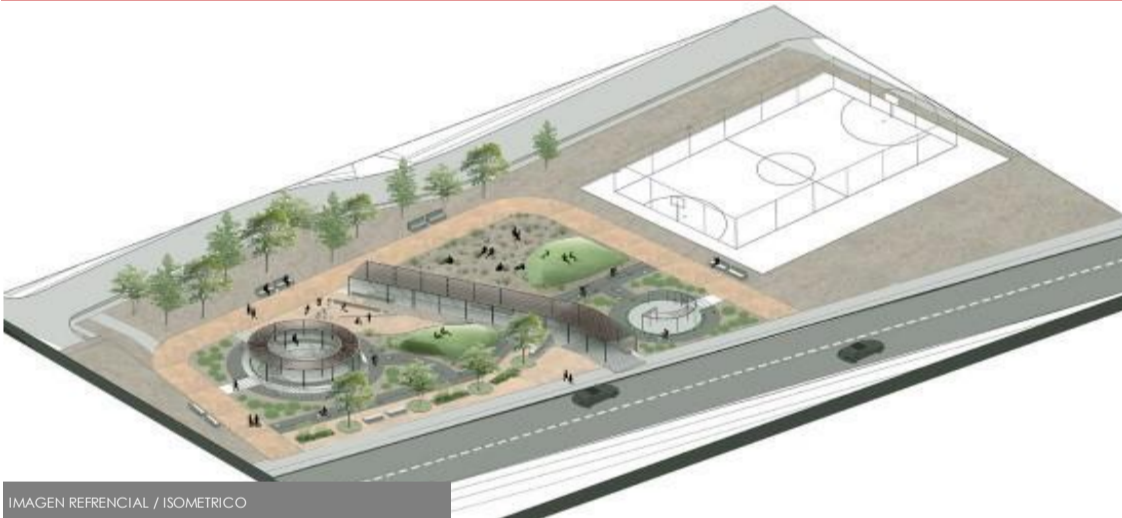
IMAGEN REFERENCIAL / ISOMETRICO

OBRA: PARQUE EDUCATIVO PARA LA SEGURIDAD VIAL, SECTOR MAGISTERIO, TALCA