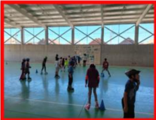
ESCUELA DE VERANO PATINAJE