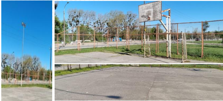
Imagen actual de Multicancha barrio Abate Molinera, luminaria, arcos, carpeta hormigón