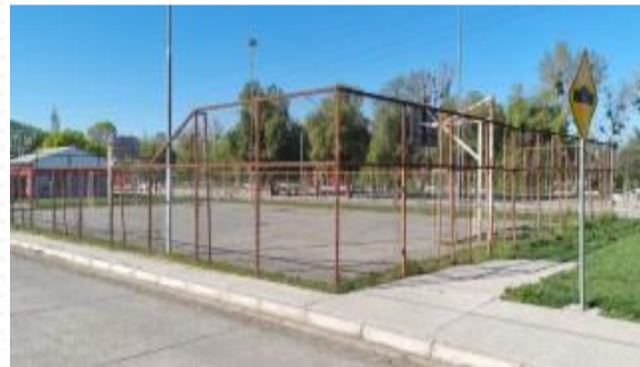
Multicancha barrio Abate Molina - Costanera