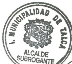
JUAN CARLOS DÍAZ AVENDAÑO Alcalde(S) Ilustre Municipalidad de Talca