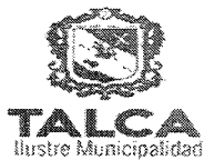
TABLA COMPLEMENTARIA SESION ORDINARIA CONCEJO COMUNA DE TALCA 18 de Agosto de 2015 - 16:00 HORAS