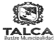
TABLA COMPLEMENTARIA SESION EXTRAORDINARIA CONCEJO COMUNA DE TALCA

MARTES 29 DE MARZO DE 2016 - 16:30 HORAS