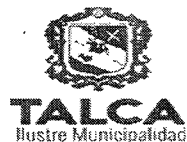
TABLA COMPLEMENTARIA SESION ORDINARIA CONCEJO COMUNA DE TALCA MARTES 12 DE ABRIL DE 2016 - 16:00 HORAS