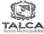
TABLA COMPLEMENTARIA SESION ORDINARIA CONCEJO COMUNA DE TALCA

MARTES 06 DE SEPTIEMBRE DE 2016 - 16:00 HORAS