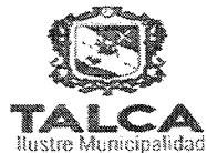
TABLA COMPLEMENTARIA SESION ORDINARIA CONCEJO COMUNA DE TALCA

MARTES 18 DE OCTUBRE DE 2016 - 16:00 HORAS