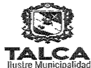
TABLA COMPLEMENTARIA SESION ORDINARIA CONCEJO COMUNA DE TALCA

MARTES 13 DE DICIEMBRE DE 2016 - 17:00 HORAS