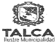
TABLA COMPLEMENTARIA SESION ORDINARIA CONCEJO COMUNA DE TALCA

MARTES 19 DE DICIEMBRE DEL 2017 - 17:00 HORAS