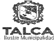
TABLA COMPLEMENTARIA SESION ORDINARIA CONCEJO COMUNA DE TALCA

MARTES 20 DE MARZO DEL 2018 - 17:00 HORAS