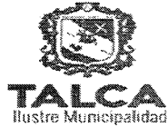
TABLA COMPLEMENTARIA SESION ORDINARIA CONCEJO COMUNA DE TALCA

MARTES 05 DE JUNIO DEL 2018 - 17:00 HORAS