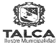
TABLA COMPLEMENTARIA SESION ORDINARIA CONCEJO COMUNA DE TALCA

MARTES 12 DE JUNIO DEL 2018 - 17:00 HORAS