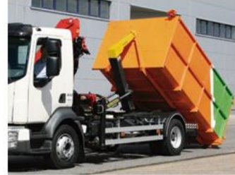
2 camiones ampliroll con cajas de 12 m 3