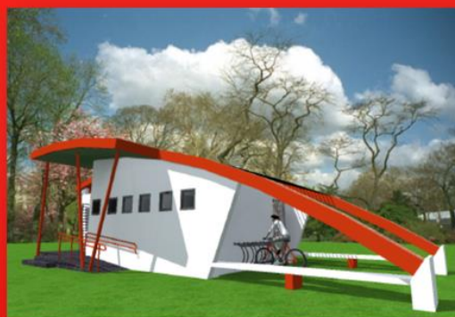
ALGUNAS IMÁGENES OBJETIVO