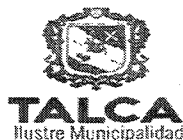
TABLA COMPLEMENTARIA SESION ORDINARIA CONCEJO COMUNA DE TALCA

MARTES 03 DE DICIEMBRE DEL 2019 - 09:00 HORAS